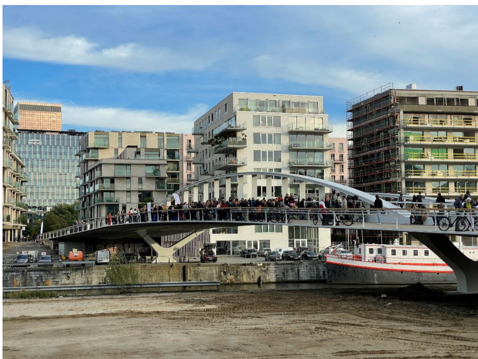
Opening van de Suzan Danielbrug