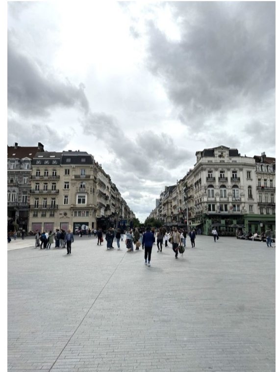
Voetgangerszone op de centrale lanen (voor de Beurs) (BRAT, 2023)