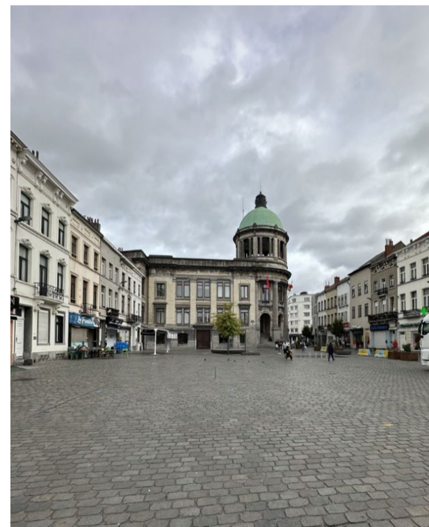
Gemeenteplaats Sint-Jans-Molenbeek (BRAT, 2023)