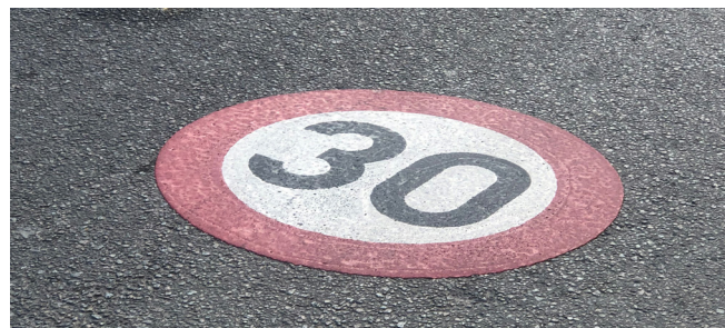
Figure 2 : Marquage C43

le C43, le panneau F4a pour les abords d'école et une reproduction en blanc du C43 (voir 6. Illustrations).