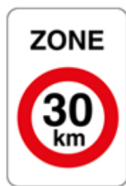
Figure 4 : F4, zone 30, en abord d'école sur une voirie à 50 km/h