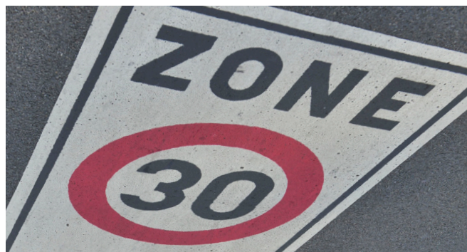
Figure 1 : Marquage de type "zone 30" (ou F4a)

En région bruxelloise, on retrouve globalement trois types de marques routières intégrant une information sur la limitation de vitesse en vigueur :