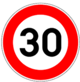
Figure 3 : C43, 30 km/h

Pour tout nouveau marquage, on privilégiera la marque routière de type C43 (30 km/h) (Figure 3) ou la reproduction du C43 unicolore en blanc (voir 6. Illustrations) afin d'éviter de la confusion pour le conducteur. Les marquages reproduisant le panneau zonal F4 (Figure 4) peuvent encore être utilisés en abord d'école sur une voirie à 50 km/h.